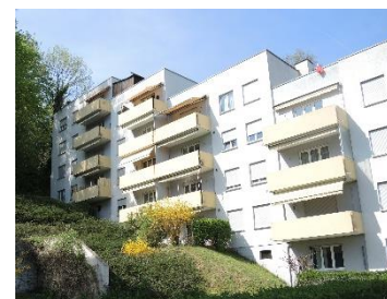
Schaffhausen, Hochstrasse 59, 69-75