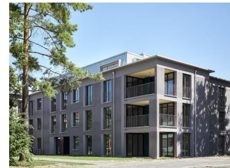
Winterthur, Wartstrasse 154-162, Blumenaustrasse 20/22