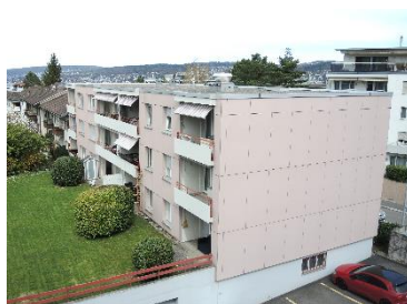
Thalwil, Freiestrasse 23-37