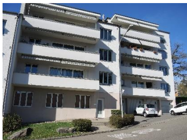
Oberengstringen, Zürcherstrasse 1a, 2b, 3, 5