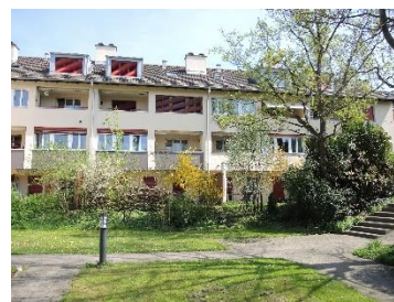
Winterthur, Stockenerstrasse 54-84, Landvogt Waser-Strasse 95-109