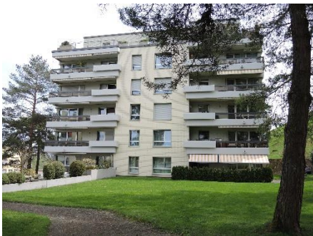
Au-Wädenswil, Alte Landstrasse 93-99