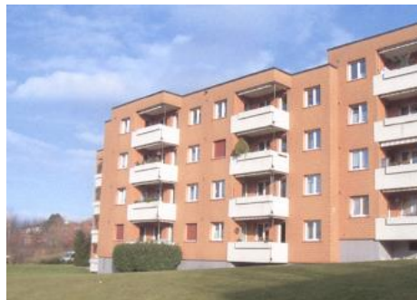
Urdorf, In der Fadmatt 1-63